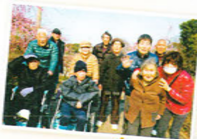
ドライブ先でハイポーズ