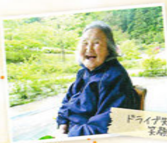
ドライブ先で笑顔いっぱい

那珂川町にお住いの要支援または要介護認定を受けた方で、『通い』『訪問』『泊まり』のサービスを利用していただくことで、ご利用者の在宅生活を支援していきます。