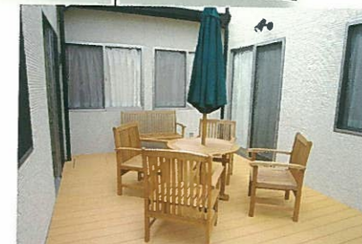
テラス(ウッドデッキ)