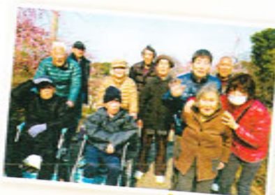
ドライブ先でハイポーズ