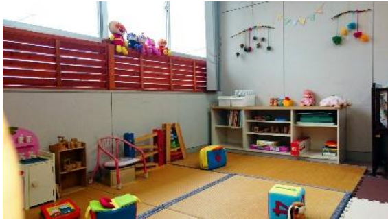
わたげるーむ からつ