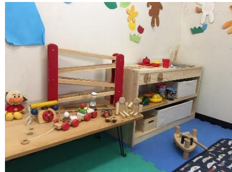
わたげるーむ さが