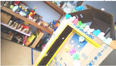
わたげるーむ たけお