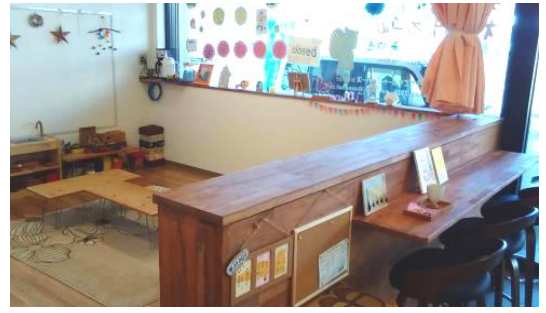
わたげるーむ みやき