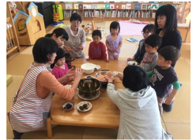
季節のおやつ作り