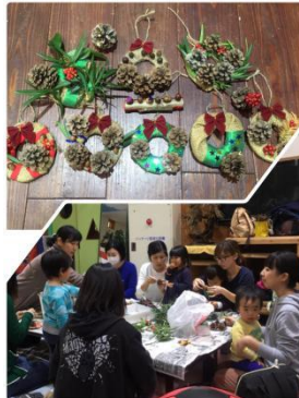
季節の手作り講座