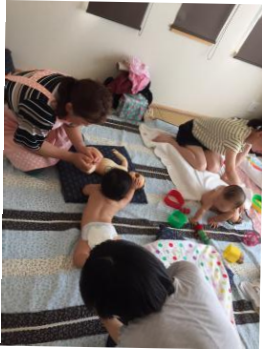
助産師によるベビーマッサージ