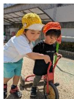
気分転換に廊下で遊ぶ0歳児と1歳児